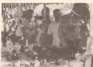
E promer feria popular di artesanía na Aruba (December 1978).